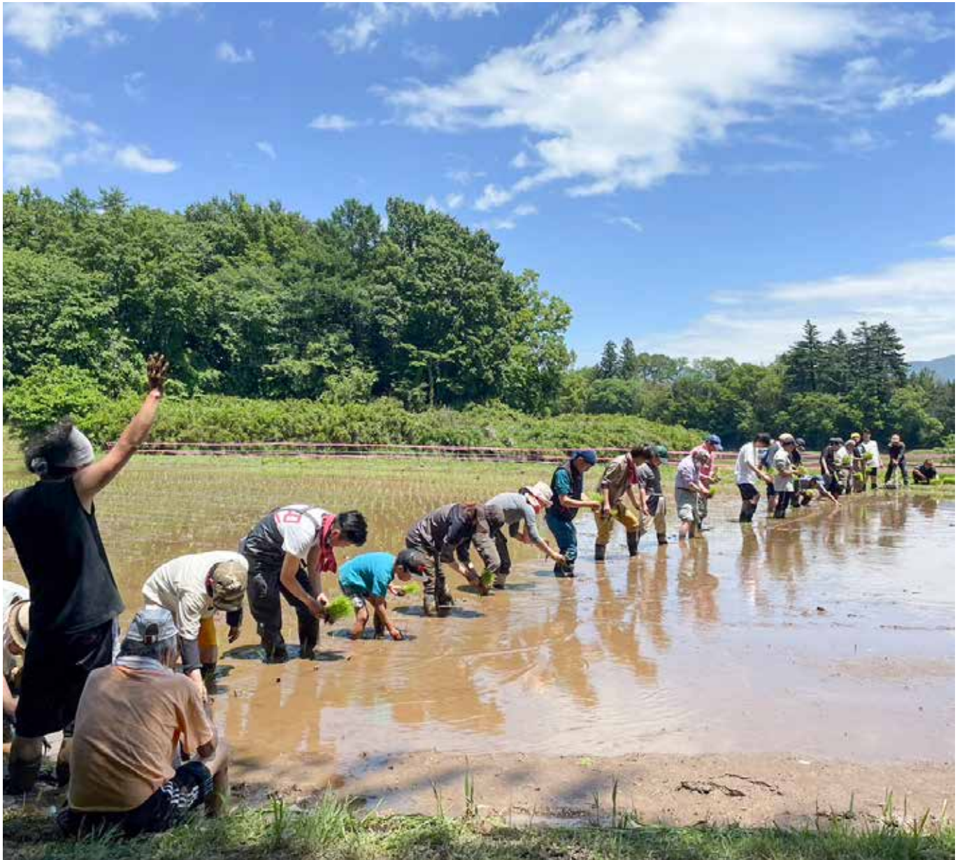
6/3(土) 3年ぶりの田植え祭り